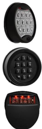
Exempel på tillhörande knappsatser